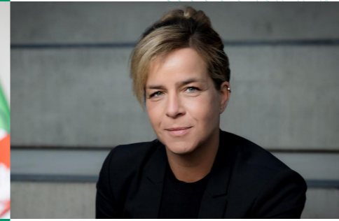
Hendrik Wüst MdL Ministerpräsident des Landes Nordrhein-Westfalen

Nur das bereits Mögliche tun, das ist klugen Köpfen zu wenig. Und für die großen vor uns liegenden Aufgaben der doppelten Transformation mit dem Weg zur Klimaneutralität und dem Übergang zur digitalen Gesellschaft benötigen wir genau dieses Mindset, das Möglichkeitsschranken öffnet. Innovationen, in Form von neuen Produkten und Geschäftsmodellen sowie effizienteren Produktionsweisen, durchbrechen solche Schranken, verschieben die Möglichkeitsgrenzen und erfinden bestehende Prozesse und Märkte neu.